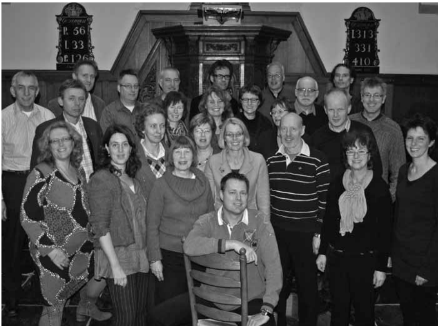
kamerkoor Sine Nomine in 2011